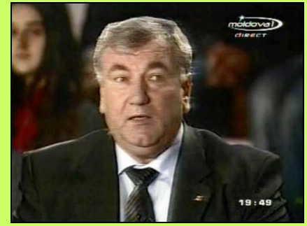
Leonid BUJOR Ministrul Educației al Republicii Moldova:

„A fost dificil și, totodată, interesant să comunicăm cu semenii noștri și să vedem care sunt opiniile lor despre drepturile copilului. Consider că acești copii nu au fost destul de sinceri în răspunsurile lor. Deși noi le-am promis anonimatul, ei aveau, totuși, teama că aceste chestionare de cercetare a opiniei lor vor ajunge în mâinile unor adulți”.