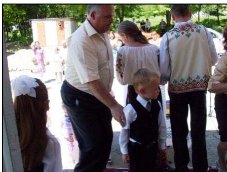
Imagine: inaugurarea grădiniței renovate din satul Măgureanca, raionul Fălești

GRĂDINIȚA DIN MĂGUREANCA, FĂLEȘTI, A FOST REACTIVATĂ