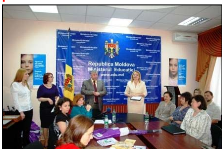
CONCURSUL „CEA MAI ACTIVĂ ECHIPĂ COMUNITARĂ”