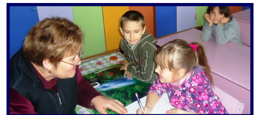
Seminar pentru elevii gimnaziului din Tătărăuca Veche

I n perioada decembrie 2013 — februarie 2014, cei 2200 de locuitorii ai comunei Tătărăuca Veche, Soroca, au fost informați despre beneficiile serviciului public de iluminare stradală, dar și despre responsabilitatea cetățenilor de a achita la timp facturile pentru acest bun comun. Primele activități de informare a comunității au avut loc în toamna anului 2012. Sistemul modern și econom de iluminare stradală pentru cele șase localități ale comunei a fost creat cu sprijinul financiar al proiectului „Modernizarea serviciilor publice locale în Republica Moldova”, gestionat de Agenția de Cooperare Internațională a Germaniei (GIZ). GIZ a acordat suportul prin intermediul Agenției de Dezvoltare Regională Nord.